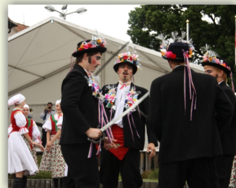
Komňané ve Vilémově