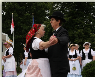
projekt Cesty k tradicím